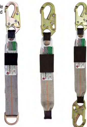
Fig.2 Accesorio del ExTender